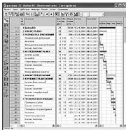
Рис.1. Диаграмма Гантта проекта выбора ПО

Данные компьютерного моделирования проектов могут быть представлены в разнообразных табличных и графических формах. На рис.1 представлена диаграмма Гантта проекта выбора программного обеспечения, отражающая не только сами работы проекта, но и назначения ресурсов.