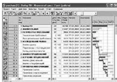
Рис.3. Целевое расписание исполнения проекта выбора программного обеспечения, составленное для обеспечения 70% вероятности успешного соблюдения запланированных сроков

Пользователь разрабатывает три сценария реализации проекта: оптимистический, включающий только те события риска, вероятность которых очень велика, и базирующийся на оптимистических оценках параметров проекта; наиболее вероятный, включающий просто вероятные события и обычные оценки параметров проекта; пессимистический, включающий менее вероятные события и пессимистические оценки параметров проекта. На базе этих сценариев аппроксимируются распределения вероятности параметров проекта, которые позволяют дать ответы на насущные вопросы менеджера: какими должны быть плановые параметры реализации проекта и его отдельных фаз, чтобы гарантировать их успешное соблюдение с заданными вероятностями; какие резервы по срокам, стоимостям и расходам материалов должны быть предусмотрены на отдельных операциях и фазах проекта для достижения целевых параметров проекта с заданной вероятностью.