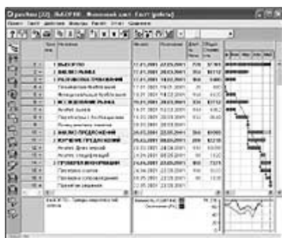
Рис.4. Тренды вероятностей успеха проекта выбора ПО

Анализ исполнения в Spider Project рекомендуется вести тремя основными способами: анализом освоенных объемов, анализом трендов вероятности успеха и анализом ресурсов. Анализ освоенных объемов мало отличается от того, что используется в западных пакетах — оцениваются текущие значения Плановой стоимости запланированных работ, Плановой стоимости выполненных работ, Фактической стоимости выполненных работ и вычисляется стандартный набор показателей Анализа освоенных объемов. Основное отличие Spider Project — возможность определения трендов этих показателей, что позволяет оценить не только текущий статус проекта, но и намечающиеся тенденции.